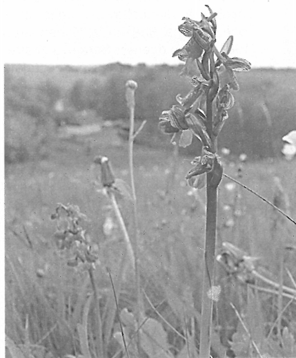
Vstavač kukačka na těšovských pastvinách (J.Bartoš)

Jak se již pomalu stává tradicí, vyrazili jsme i letos „počítat kukačky“ na Těšovské pastviny. Malebné stráně u Těšova jsou totiž významnou botanickou lokalitou, na níž se