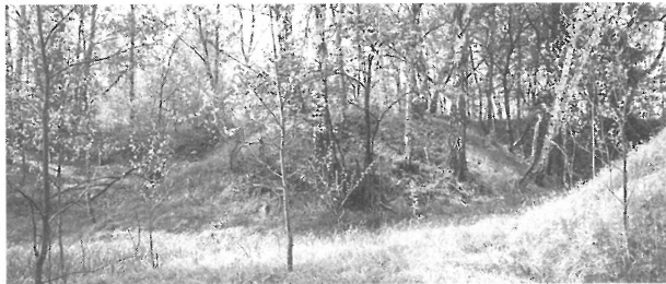
Pohled na ringval z místa bývalé hráze (Z.Buchtele)

Vedle staré cesty vedoucí z Úbočí do Miliíkova, v místech kde prochází těsně kolem Černého rybníka, byl v sobotu 15. května učiněn zajímavý objev. Je to objekt ringvalu, nebo tvrziště, téměř kruhového tvaru, o průměru zhruba 10 metrů, vystupující od zmíněné cesty do 4 metry hluboké rokle. Vlastní plocha ringvalu je oproti cestě asi o 50 cm níž a je od ní oddělena dobře patrným příkopem. Ten je v jednom místě zasypaný asi proto, aby se už z dávno pustého ringvalu mohla snadněji odnášet zemina, se kterou se zasypávaly a vyrovnávaly nerovnosti na cestě. V severozápadní části je takto odebrá-